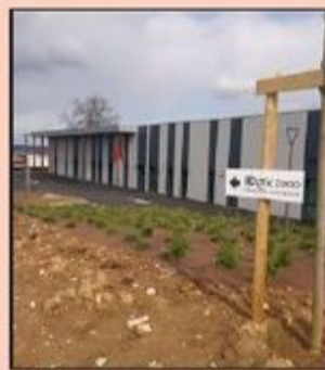
Citévie : le bâtiment A encore en chantier.