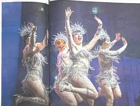
Le show burlesque des pin-up d'Alsace a fait salle comble vendredi soir à l'Axone. La première journée de la Foire Expo a enregistré 2 400 entrées.