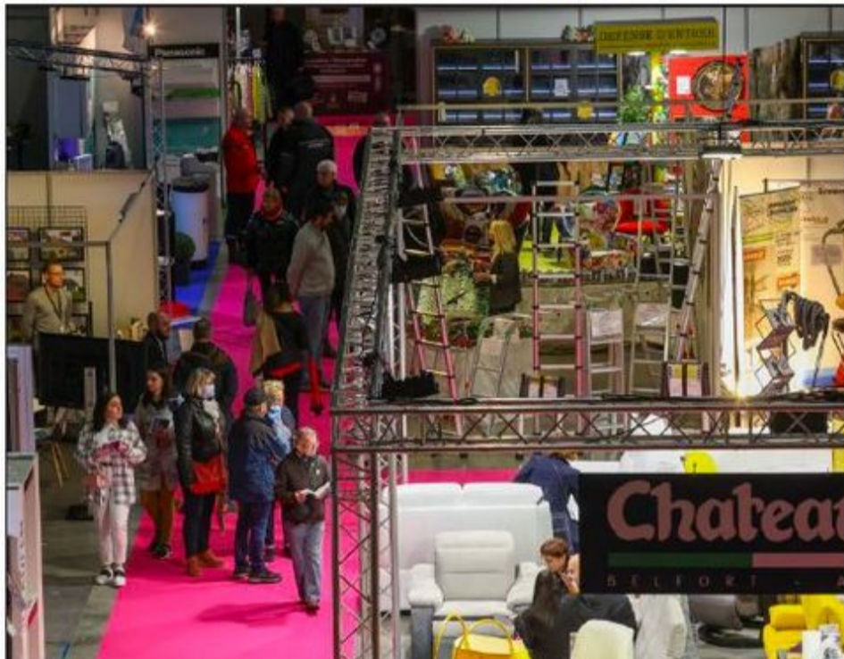
L'organisateur de cette 8 e foire expo indique que 10 000 à 12 000 visiteurs sont attendus cette année.

Parmi les animations plus insolites, on retrouve pour la deuxième année le show burlesque des pin-up d'Alsace le