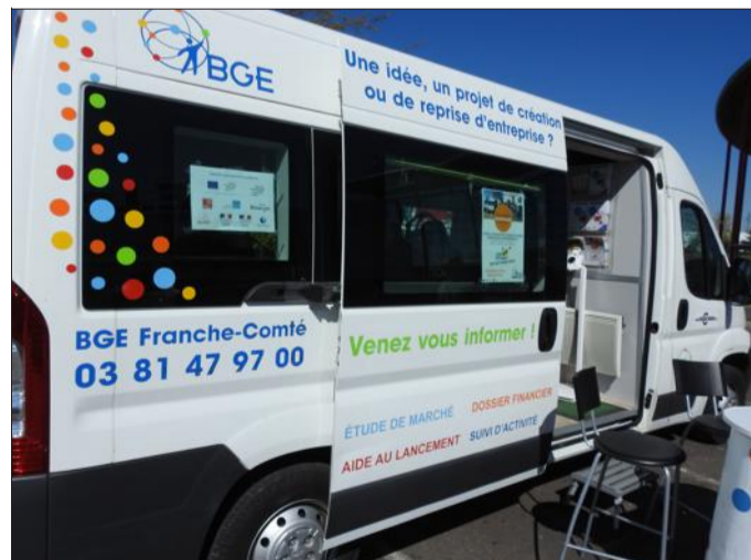
C'est avec de nouvelles couleurs et une police plus lisible que le BGE bus se modernise.

Vous avez en tête l'idée de créer votre entreprise ? Le BGE bus peut vous y aider. Ce dispositif, baptisé « créaffaire », répond gratuitement et sans rendez-vous aux questions des entrepreneurs en devenir, qui jusqu'à maintenant sont 3 500 avoir été accompagnés. Au programme, des conseils, des ateliers et même un speed meeting prévu le 22 juin prochain : les porteurs de projet pourront profiter « de rendez-vous de 30 minutes pour rencontrer des experts de la création d'entreprise », explique Tiphaine Girardot, responsable communication de BGE Franche-Comté. Les dossiers sont étudiés en amont, et quelqu'un qui, par