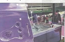
En quête de bien ou mieux être à la maison depuis la crise sanitaire.

Le Covid a eu des effets improbables, comme la recherche du bien-être à la maison pendant et après le confinement », constate Angélique Chevalley, de l'entreprise Piscines & spas, basée à Châtenois-les-Forges. « Le budget vacances a été investi dans la maison, avec un engouement marqué pour le spa, trouvant sa place en Franche-Comté d'avantage qui impactent le territoire de puis plusieurs été. L'introduction de remettre à niveau l'eau du bassin qui s'évapore fissa quand le soleil cogne depuis des jours et des jours a fait