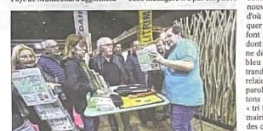
Le stand de PMA ne désemplit pas.

Sur le front de défilé des poubelles jaunes en voir d'ailleurs le tir des déchets, le mois de mars fut sur les charbons ardents pour les agents de Puro de Montbéliard à l'agence