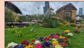
Les créations florales ne furent pas à la fête pendant la foire expo.

Un temps à ne pas mettre un pétale dehors