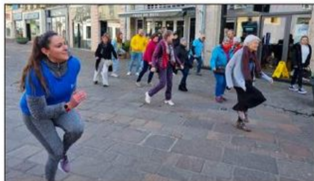
Échauffement avant la marche bleue de sensibilisation au dépistage du cancer colorectal.

Non, les marcheurs qui foulent le bitume du carré piéton mardi ne militent pas pour le départ à la retraite à 74 ans. Juste pour que les Comtois âgés de 50 à 74 ans ne boudent pas le test de dépistage du cancer colorectal. « Car plus le cancer est détecté précocement, plus les chances de guérison sont grandes, moins les traitements sont lourds », insiste Sylvie Simon du centre régional de dépistage des cancers qui distille l'info au stand Mars bleu installé square des Droits de l'homme.