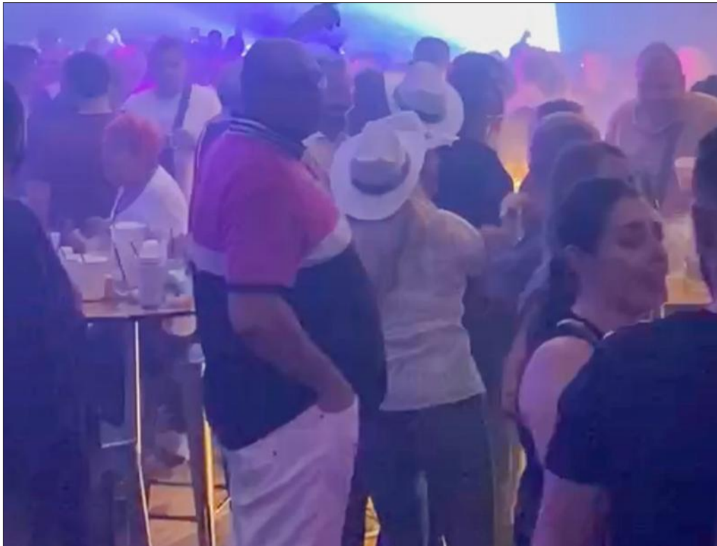
Des soirées dansantes sont programmées durant la foire expo.