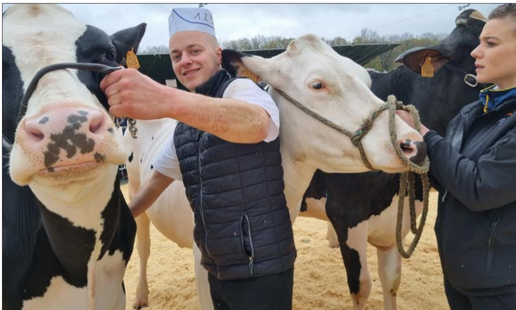
Au fil des années, le concours agricole s'est imposé comme un incontournable de la Foire Expo.

Dans le berceau même de la montbéliarde, pas l'ombre d'une vache rouge ce week-end à l'Axone alors que d'ordinaire, le samedi est dédié à la fameuse élection de Miss Ber-