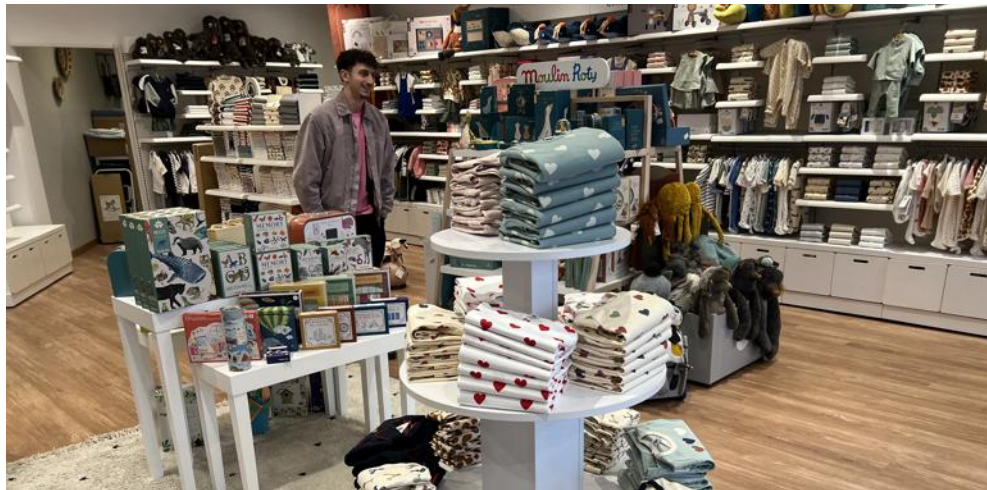
La boutique Victor et Louise a déménagé dans un local plus grand autour de la place de la Commune de Paris.

« Nous l'avons quitté pour nous installer dans un local plus grand de 100 m 2 de l'autre côté de la place de la Commune de Paris », explique Natacha Sommer. « Il permettra de dévoiler un plus grand nombre d'articles. » Ce local situé à côté de la Fée Maraboutée a été re-