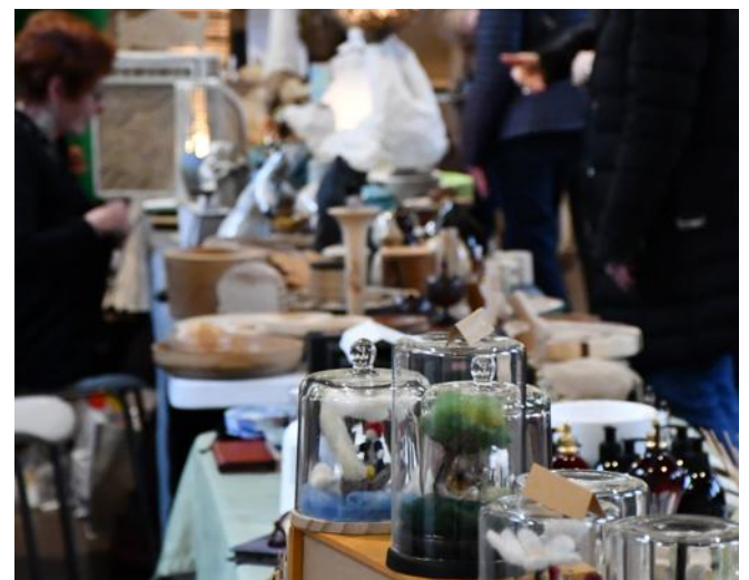
Les visiteurs sont venus à la rencontre de la dizaine d'artistes locaux amateurs, qui exposaient au marché de l'association « Mine de rien la récup' c'est de l'art ».

L'association « Mine de rien la récup' c'est de l'art » a organisé dimanche 3 mars la troisième édition de son marché d'artistes locaux, à la maison de quartier municipale de la vieille ville à Belfort. « Nous sommes satisfaites de la fréquentation. Cette année, nous avons équipé un homme-sandwich qui a arpenté les rues du marché aux pu-