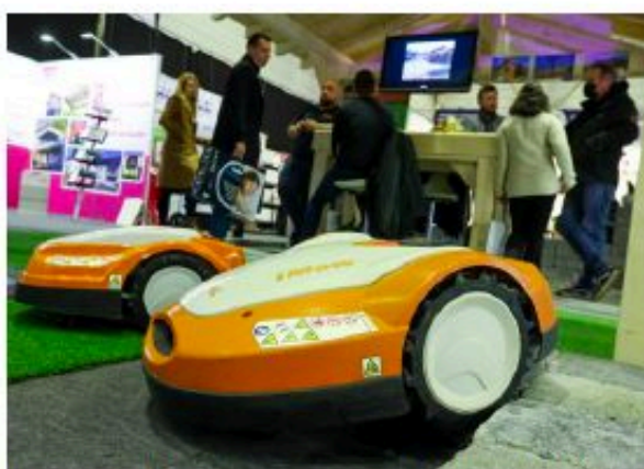
On connaissait les robots aspirateurs à l'intérieur, il y a aussi les robots tondeuses sur les gazons.

Avec le développement du télétravail, aménager une terras-