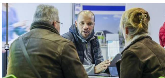
Le Salon Habitat & Jardins se tient encore ce dimanche jusqu'à 19h. L'entrée est gratuite.

Salon Habitat et Jardins, L'AtraXion à Andelnans, de 10 à 19h, entrée gratuite