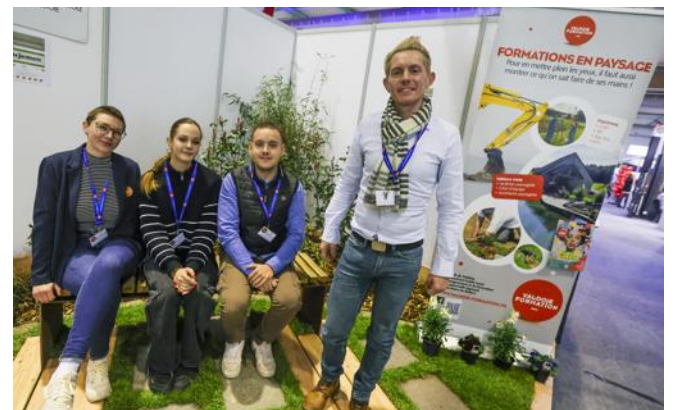
Le lycée agricole Lucien-Quélet à Valdoie forme des paysagistes.

L'établissement agricole Lucien-Quélet (lycée, CFA, CFPPA) est réputé pour ses paysagistes, avec des formations qui vont du CAP au BTS. Il a aménagé un espace végétal en plein milieu du salon