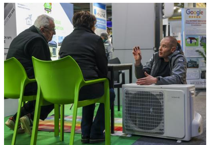
Le salon regroupe 90 exposants cette année.