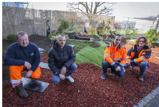
L'équipe des espaces verts de la Ville de Belfort qui a réalisé le massif végétal situé à l'entrée du salon Habitat & Jardins.