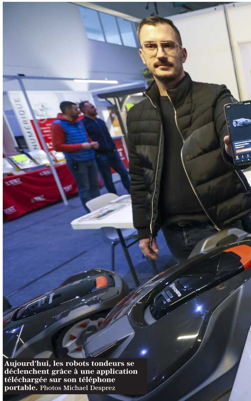
Aujourd'hui, les robots tondeuses se déclenchent grâce à une application téléchargée sur son téléphone portable. Photos Michael Desprez