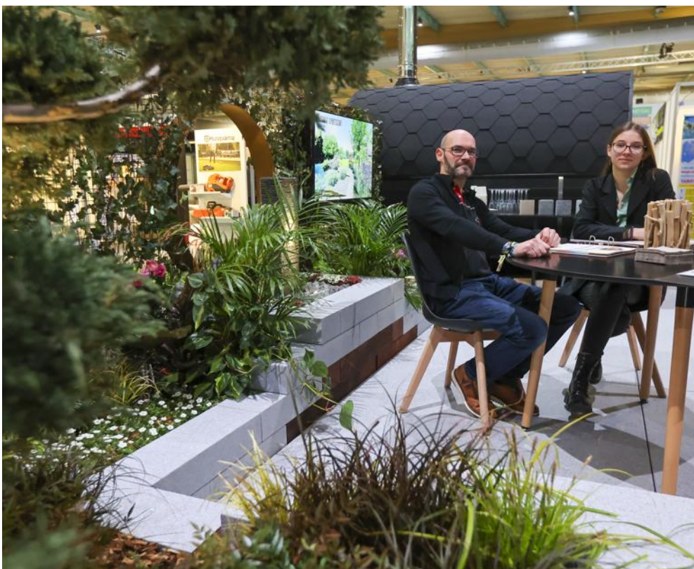
Chouffot paysagiste a créé un aménagement extérieur sur mesure juste pour le salon.

Cette année, un des premiers stands qu'on découvre en entrant dans le salon est celui de la société Chouffot, d'Étupes.