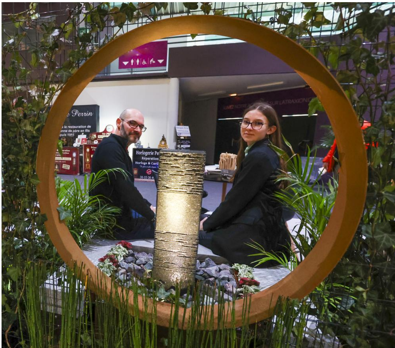
Le salon Habitat & Jardins a ouvert ses portes vendredi à l'Atraxion à Andelnans avec 90 exposants. Il durera tout le week-end. L'entrée est gratuite.