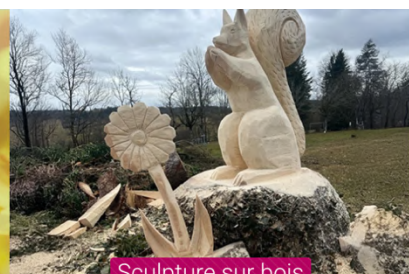
Sculpture sur bois

Les équipes des Espaces Verts de la Mairie de Mandeuire ont la main verte et ont imaginé un jardin éphémère musical !