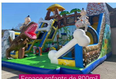
Espace enfants de 800m 2

Des Animations mêmes à l'extérieur, pour les grands et les petits !